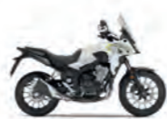
Pearl Metalloid White