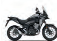
Mat Gunpowder Black Metallic