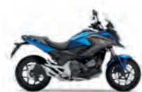
Glint Wave Blue Metallic