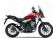
Grand Prix Red

ProLink® mono s 5stupňovým nastavením předpětí, kyvná vidlice z ocelové trubky čtvercového průřezu