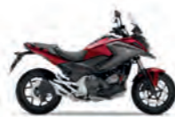
Candy Chromosphere Red