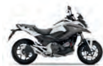
Pearl Glare White