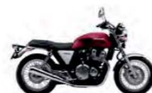
Candy Chromosphere Red