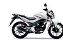
Pearl Sunbeam White