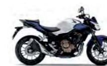
Pearl Metalloid White