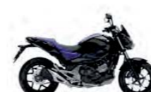
Graphite Black / Blue Metallic

Tlumič Monoshock, kyvná vidlice Pro-Link, zdvih 120 mm