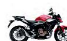
Grand Prix Red

Tlumič Prolink mono s 9stupňovým nastavením předpětí, kyvná vidlice z trubky čtvercového průřezu