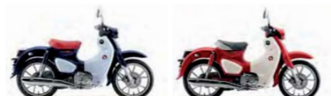
Pearl Niltava Blue