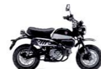
Pearl Shining Black