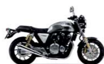
Mat Beta Silver Metallic