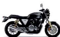
Darkness Black Metallic