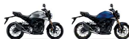
Mat Crypton Silver Metallic