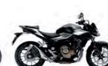
Mat Gunpowder Black Metallic