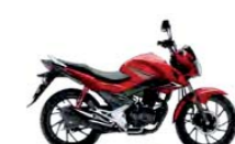
Candy Blazing Red

Dva tlumiče s pětistupňovým nastavením předpětí pružiny