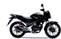
Onyx Blue Metallic