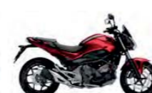
Candy Chromosphere Red