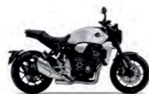
Mat Pearl Glare White