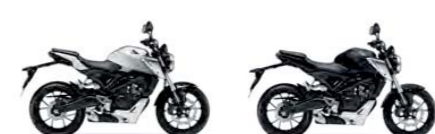
Pearl Metalloid White