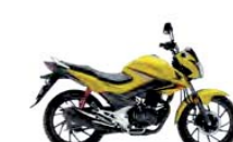
Pearl Twinkle Yellow