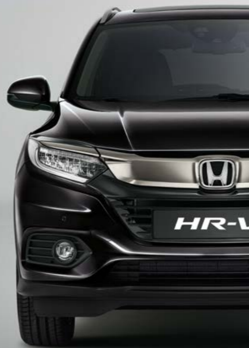
PERLEŤOVÁ CRYSTAL BLACK