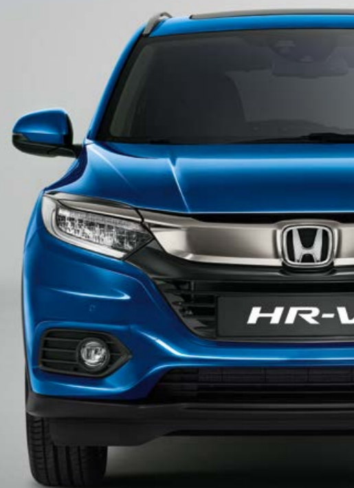
METALICKÁ BRILLIANT SPORTY BLUE