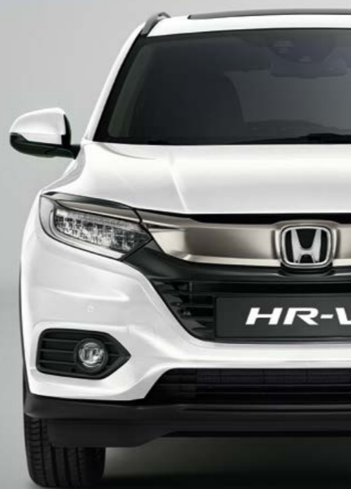
PERLEŤOVÁ PLATINUM WHITE