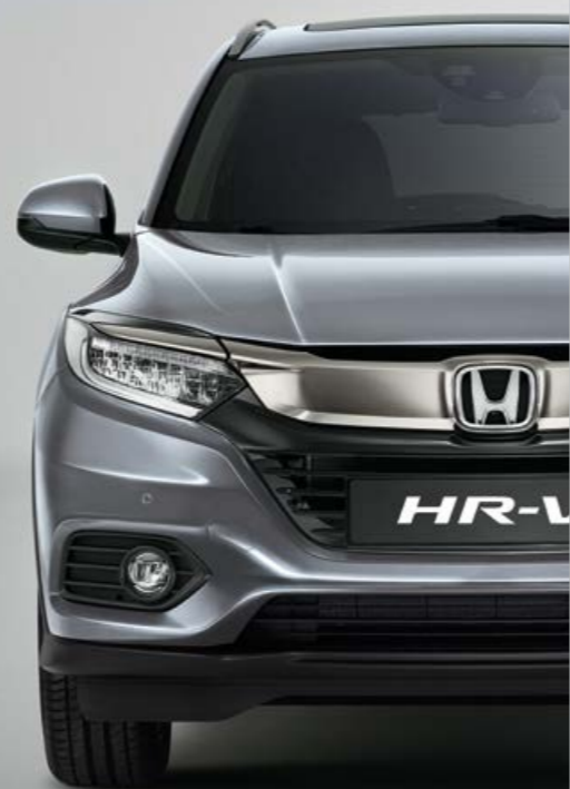
METALICKÁ LUNAR SILVER