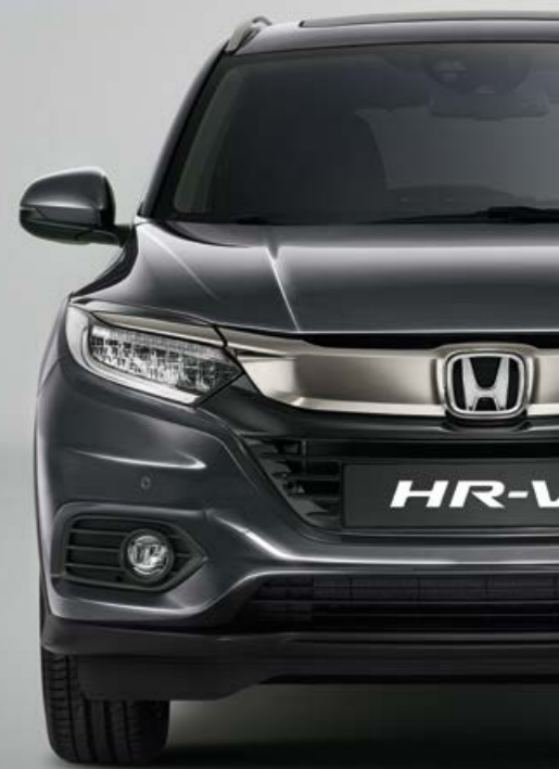
METALICKÁ MODERN STEEL