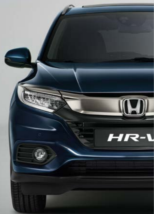
METALICKÁ MIDNIGHT BLUE BEAM

Nabídka barev, které zní stejně dobře, jako vypadají. Od barvy metalická Midnight Blue Beam po barvu Milano Red, vždy najdete volbu, která bude dokonale ladit s vaší osobností.