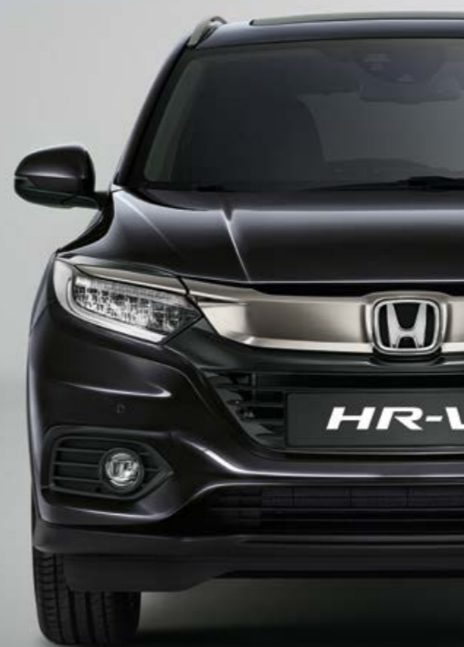
METALICKÁ RUSE BLACK