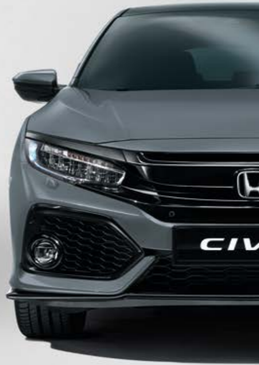
PERLEŤOVÁ SONIC GREY