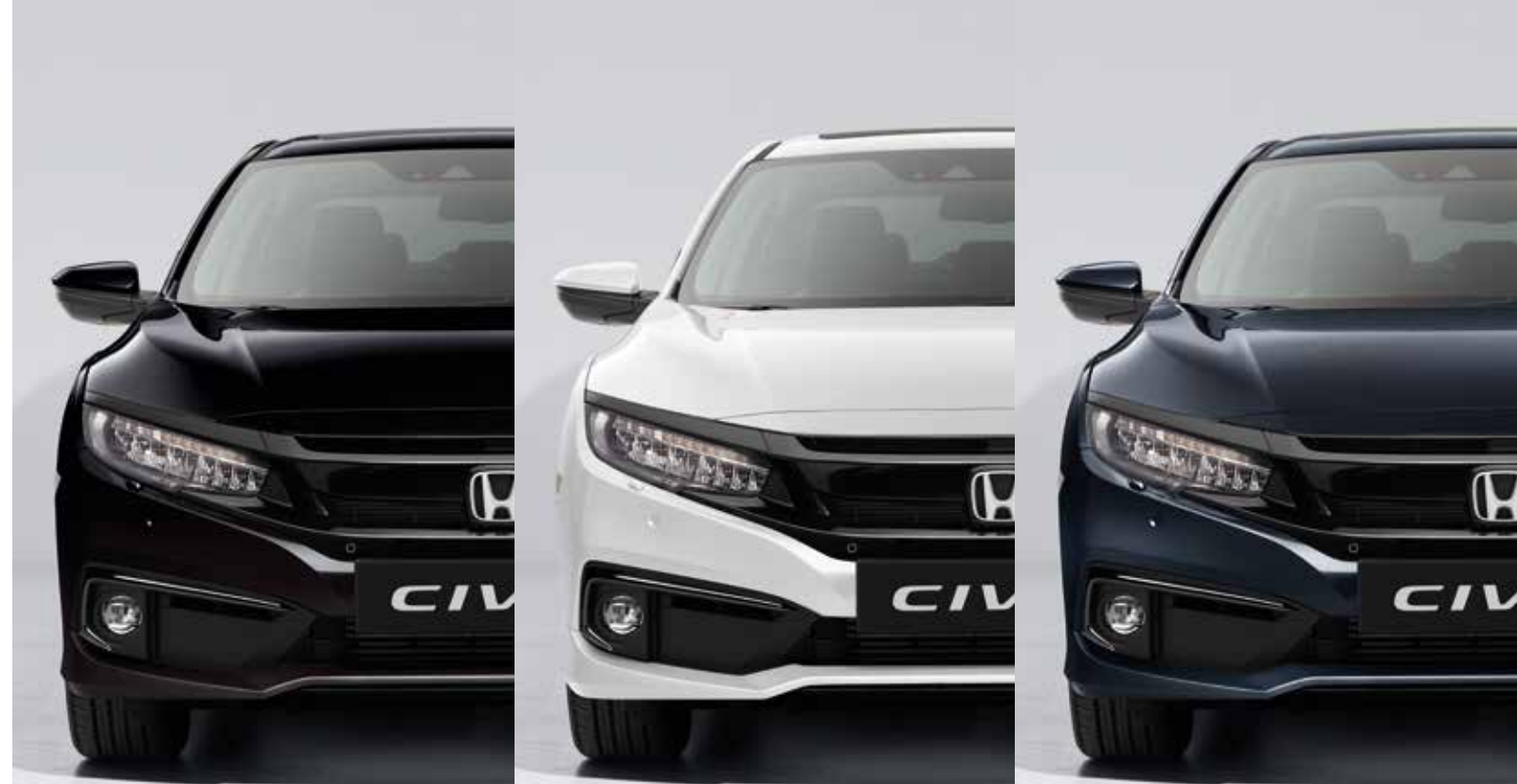
PERLEŤOVÁ MIDNIGHT BURGUNDY