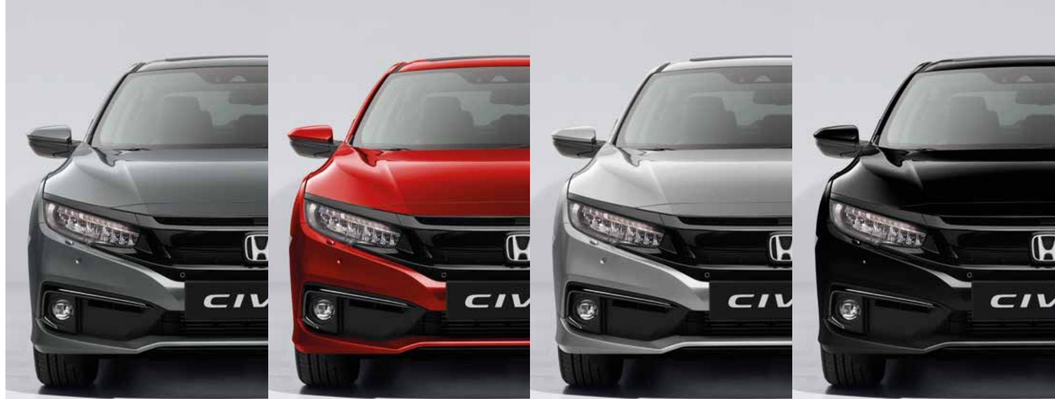
METALICKÁ POLISHED METAL

Vyobrazen je model Civic sedan s motorem 1.5 VTEC TURBO a výbavou Executive.