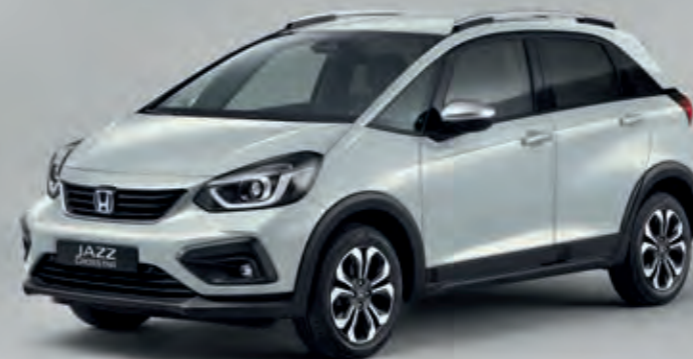
PRÉMIOVÁ PERLEŤOVÁ SUNLIGHT WHITE