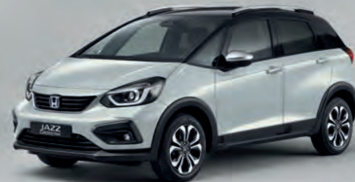
PRÉMIOVÁ PERLEŤOVÁ SUNLIGHT WHITE / DVOUTÓNOVÁ VARIANTA