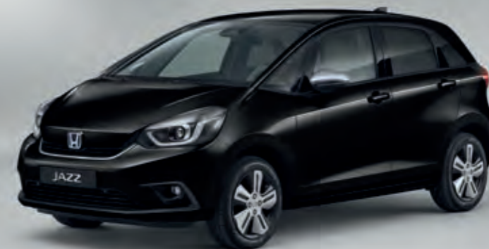
PERLEŤOVÁ CRYSTAL BLACK