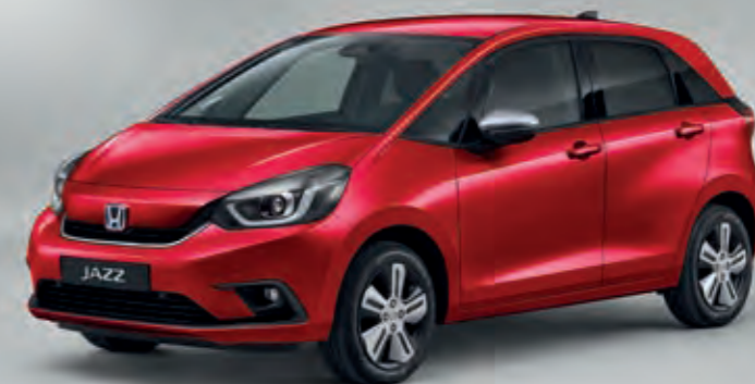
PRÉMIOVÁ METALICKÁ CRYSTAL RED