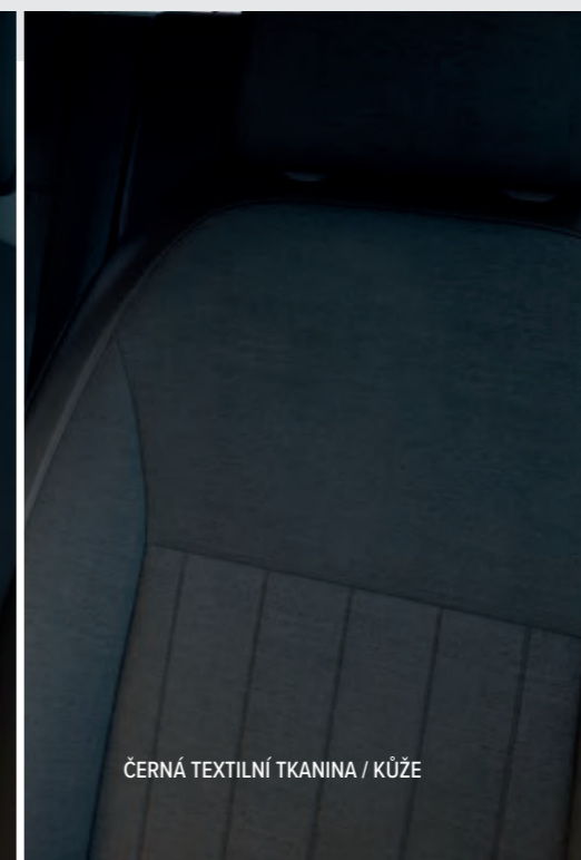
ČERNÁ TEXTILNÍ TKANINA / KŮŽE