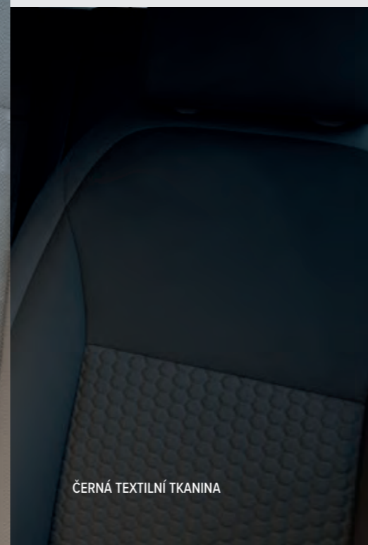
ČERNÁ TEXTILNÍ TKANINA