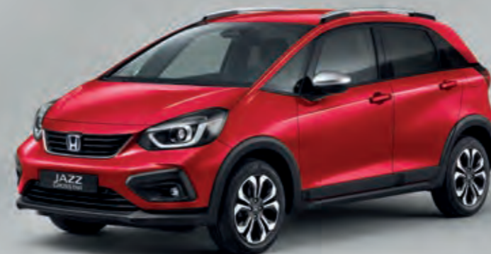
PRÉMIOVÁ METALICKÁ CRYSTAL RED