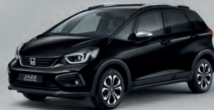
PERLEŤOVÁ CRYSTAL BLACK