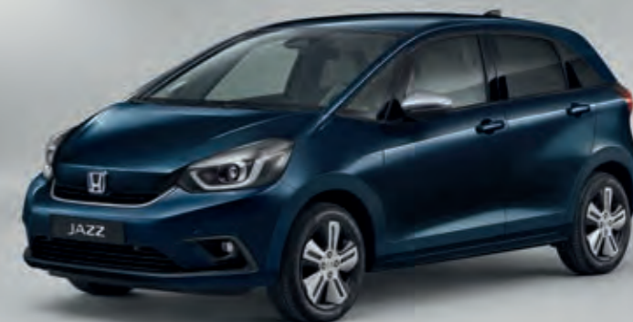
METALICKÁ MIDNIGHT BLUE BEAM