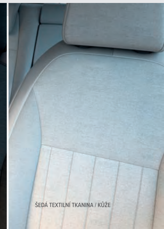
ŠEDÁ TEXTILNÍ TKANINA / KŮŽE