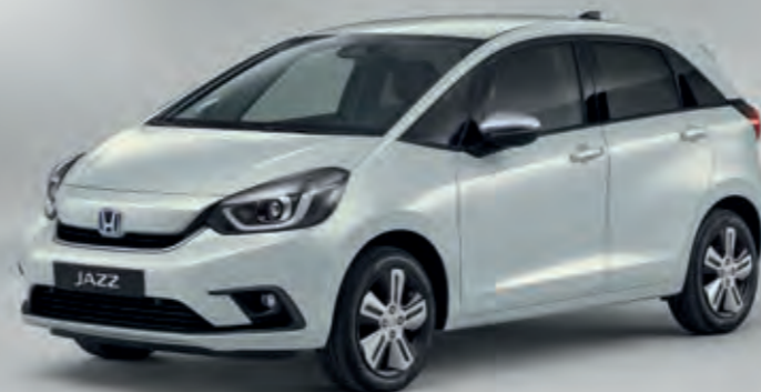
PRÉMIOVÁ PERLEŤOVÁ SUNLIGHT WHITE