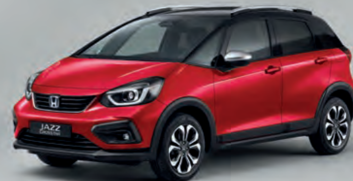
PRÉMIOVÁ METALICKÁ CRYSTAL RED / DVOUTÓNOVÁ VARIANTA