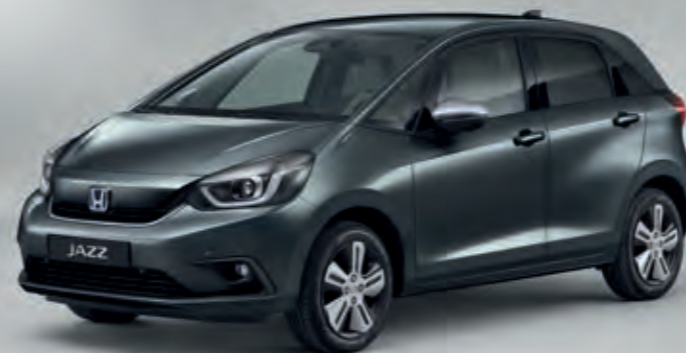
METALICKÁ SHINING GRAY